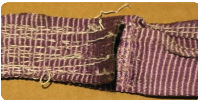
Hitsaus- tai muu kipinävaurio