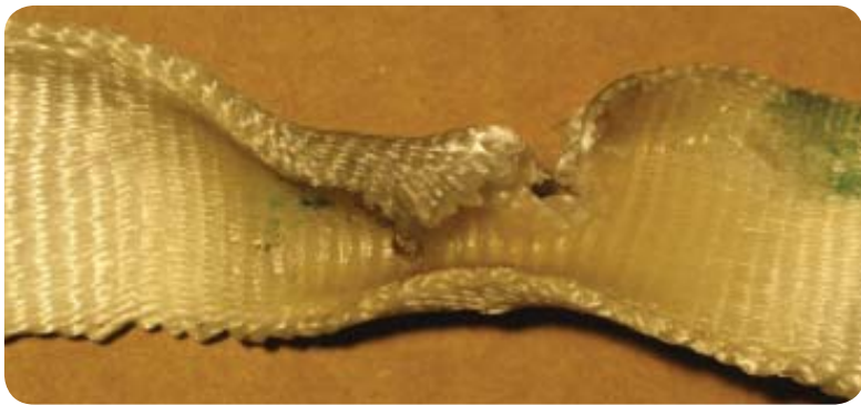
Kudelangat poikki tai viilto